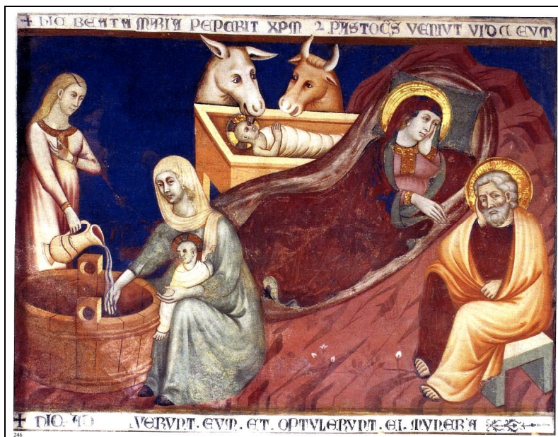
natività - abside basilica S. Abbondio, Como anno 1315 ca. *

Aderisce al Coordinamento Comasco delle realtà di accoglienza per minori e al Forum Comasco delle associazioni famigliari.